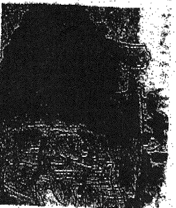
A lato la copertina del libro "Il sogno di Matilde a Canossa". In alto, alcune illustrazioni realizzate nel volume per ragazzi

nonna, di tutte le leggende che nei secoli lo hanno circondato, dalla storia strazi-